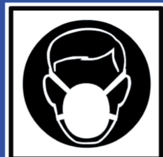
Mund/ Nasenschutz tragen