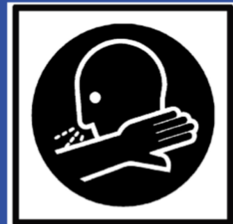
In die Armbeuge niesen