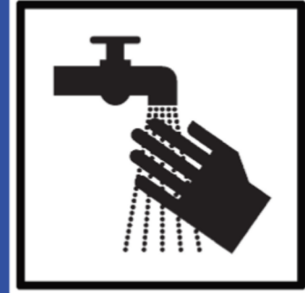
regelmäßig Hände waschen